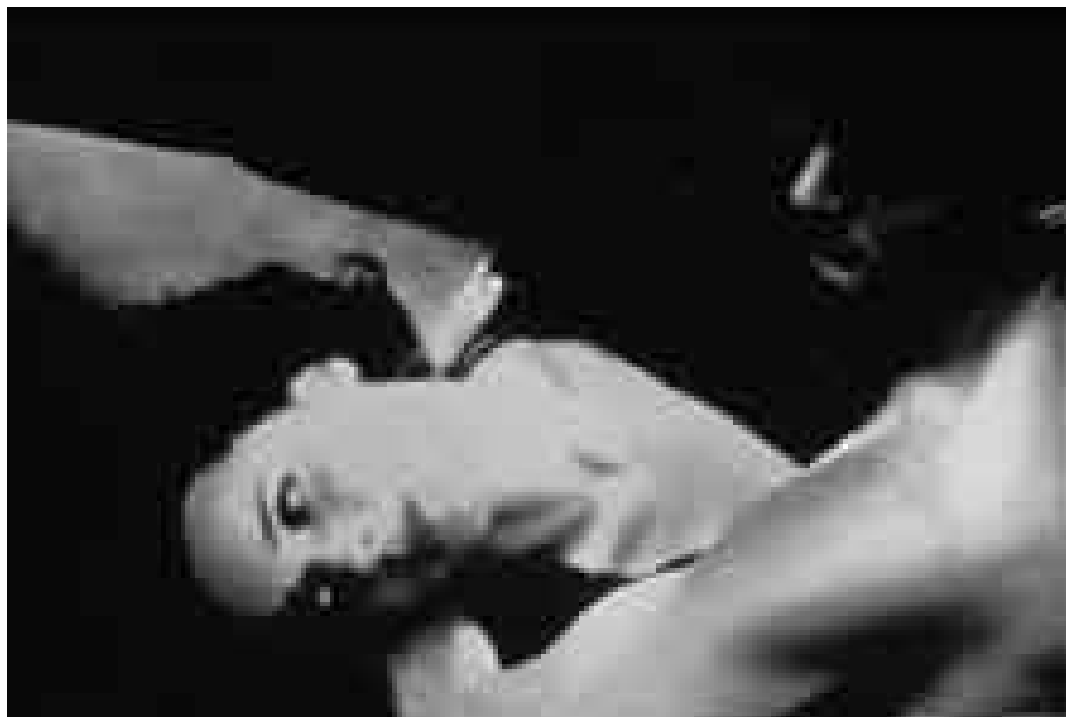
Ausschnitt aus dem Filmplakat zu Blue Velvet von David Lynch (1986).

Je näher wir uns innerlich kamen, umso mehr suchte sie äussere Distanz. Darauf angesprochen, fand sie nur Ausreden. Ich begann zu klammern. Die Vergangenheit ruhen zu lassen, wie ich es versprochen hatte, ging auch nicht mehr. Ich forschte nach Details, wollte wissen, mit wie vielen Männern sie Sex hatte, ob sie für gewisse Freier Zuneigung empfand, ob die Männer, die sie hin und wieder auf der Strasse grüssten, ehemalige Kunden waren. Sie versuchte meine Bedenken zu zerstreuen, was mich keinesfalls beruhigte. War unsere Beziehung nur ein grotesker Maskenball, wo nichts ist, was es zu sein scheint? Während sie am Anfang